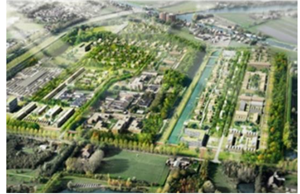
Wickevoort AM Wonen