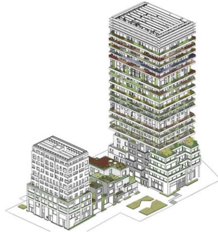
Amsterdam vertical Heijmans