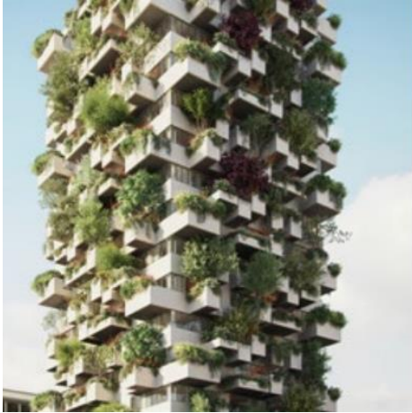
Trudotoren Sint Trudo