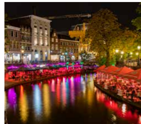
Locaties zijn onder voorbehoud